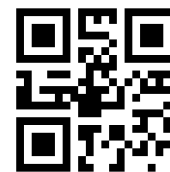
プレスリリース 2021年8月

これまで距離や時間、費用が原因で応募できていなかった、また能力はあっても機会に恵まれなかった優秀な外国人材の発掘にも寄与しています。