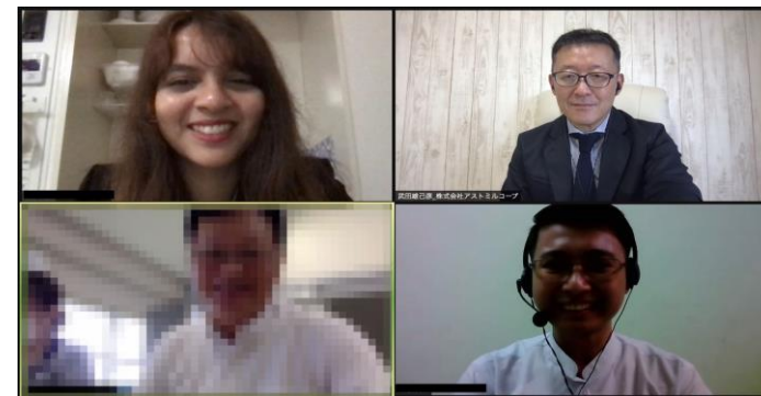
オンライン面接では同時通訳者も同席