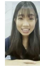
スマートフォンでも確認できる 自己紹介動画